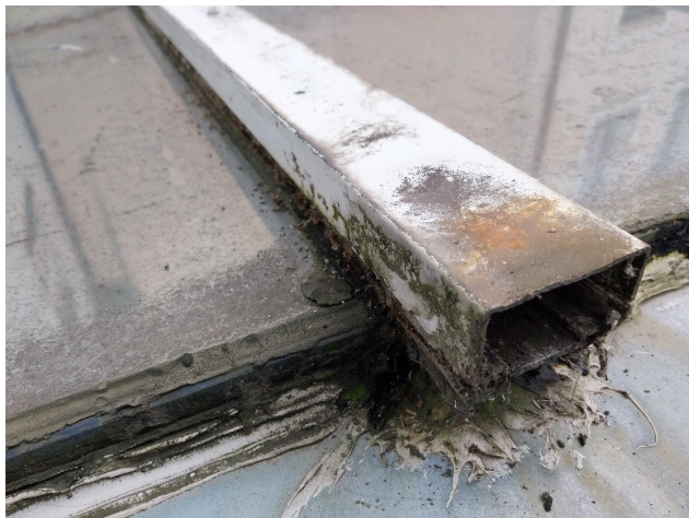
foto /3/ Pohled na těsnící profily a krycí lišty - fotografie z místního šetření [28] provedeného dne 03. 10. 2024