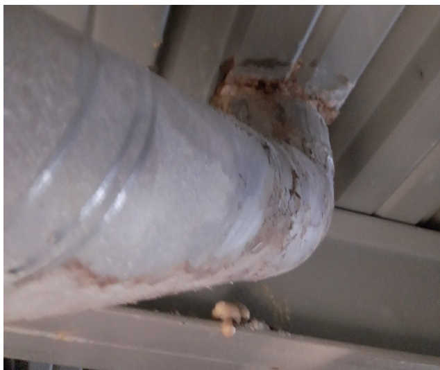
foto /1/ Pohled na 1. prostup dešťového svodu - fotografie z místního šetření [28] provedeného dne 03. 10. 2024

V interiéru v oblasti prostupů dešťových svodů byla zjištěna 2 lokální místa s vlhkostní poruchou v interiéru.