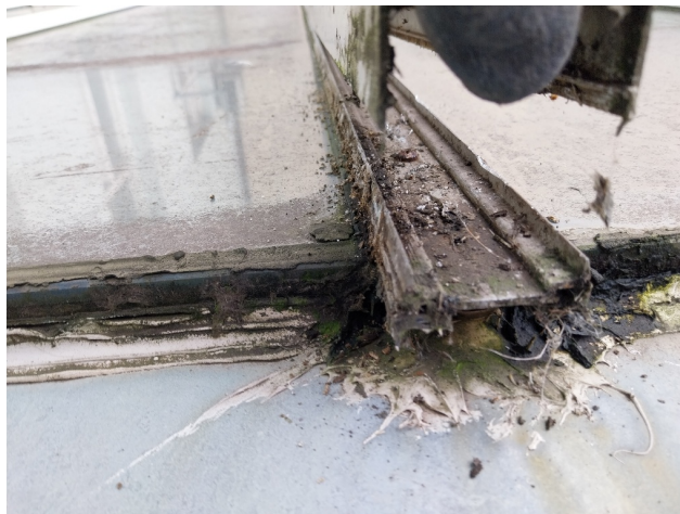
foto /4/ Pohled na těsnící profily a krycí lišty fotografie z místního šetření [28] provedeného dne 03. 10. 2024